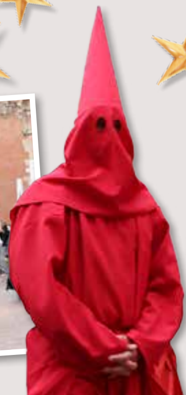
Programme sous réserve de modifications.