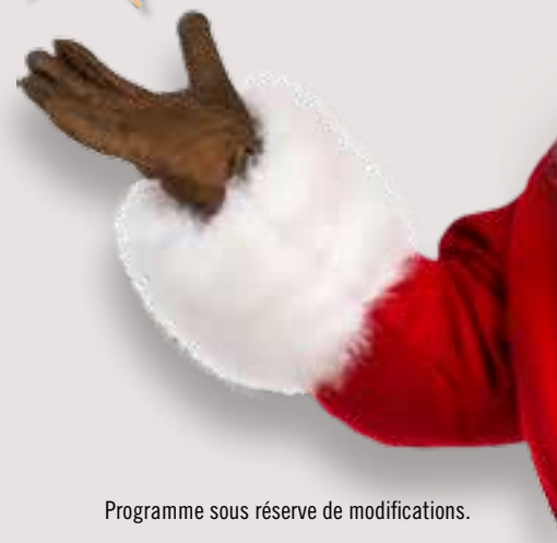
Programme sous réserve de modifications.